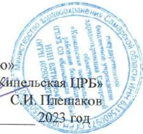
График выезда мобильных бригад для осуществления диспансеризации и вакцинации граждан, проживающих на территории удаленных и малых населенных пунктов Кинельского района на ИЮНЬ 2023 года

«Утверждаю» Главный врач ГБУЗ СО «Кинельская ЦРБ» С.И. Плешаков « 22 » 05 2023 год